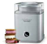
Ice Cream Makers Sorbetières

Cuisinart offers an extensive assortment of top quality products to make life in the kitchen easier than ever. Try some of our other countertop appliances and cookware, and Savor the Good Life®.